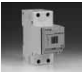
Paco 25 A