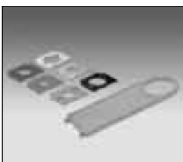
Pasplaten met montagegereedschap